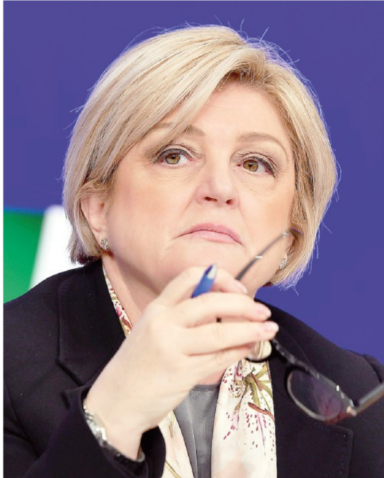
Il ministro. Marina Elvira Calderone, ministro del Lavoro e delle politiche sociali