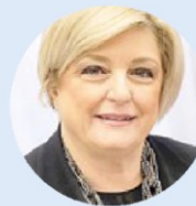
Marina Calderone. Ministro del Lavoro e delle Politiche sociali

L'intervista. Marina Calderone. Il ministro del Lavoro: «Semplificazione delle procedure per garantire maggiori tutele ai lavoratori. Penalizzare chi viola le regole ma favorire chi le rispetta anche con il metodo della collaborazione»